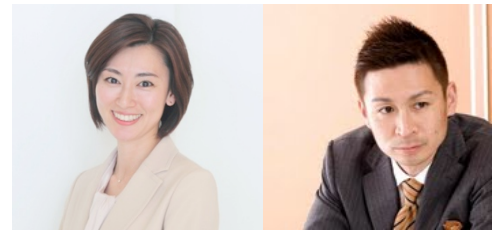
ビジネスマナーのプロ! ※講師陣は2013実績